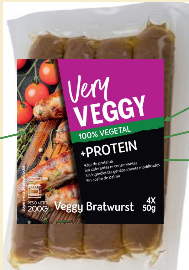
Foto Producto saludable para mayor captar a los flexitarianos