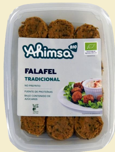
Falafel Tradicional 200g