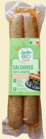
Estilo Alemana 2*100g