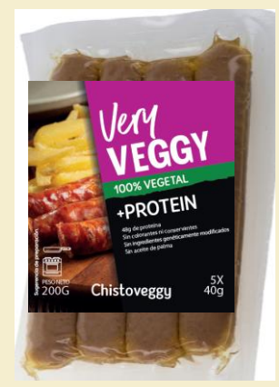
Very veggy Chistorra 200G