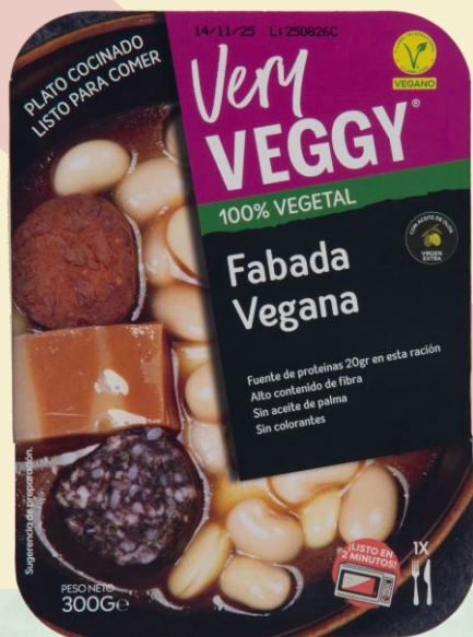
Fabada Vegana 300g