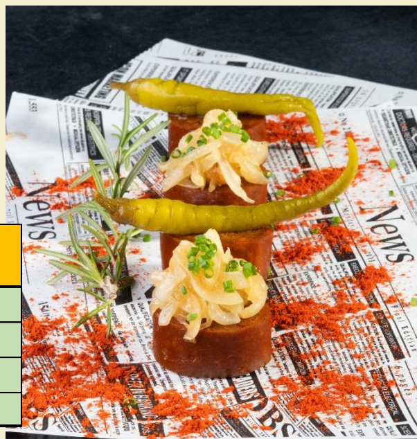
Morcilla Clásica 2*115g (Con Arroz)