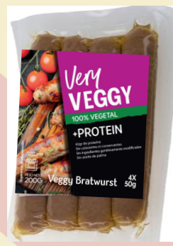
Very Veggy Bratwurst 200G