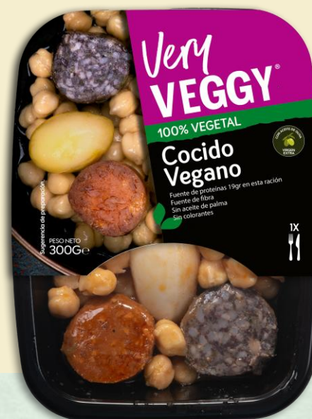
Cocido Vegano 300g