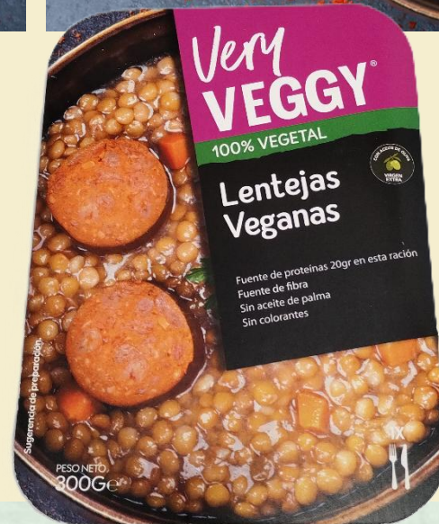
Lentejas Veganas 300g