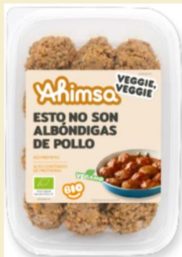
Albóndigas estilo pollo 210g

Con Ahimsa es posible disfrutar de unos ricos preparados 100% vegetales . Ideales para cocinar o a la plancha.