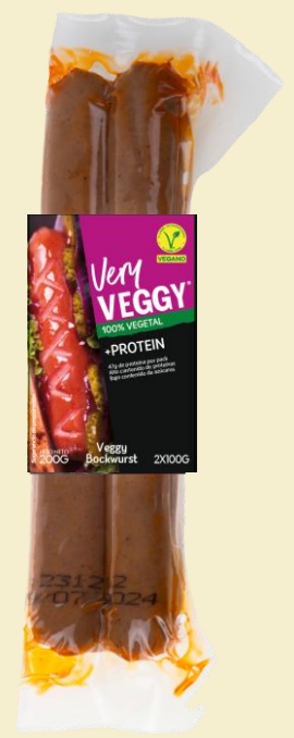
Very Veggy Bockwurst 2*100G