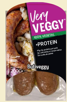
Very Veggy Butifarra 200G