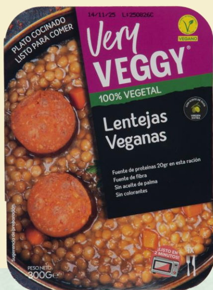
Lentejas Veganas 300g