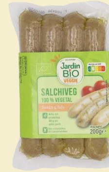
Tofu Quinoa 4*50g