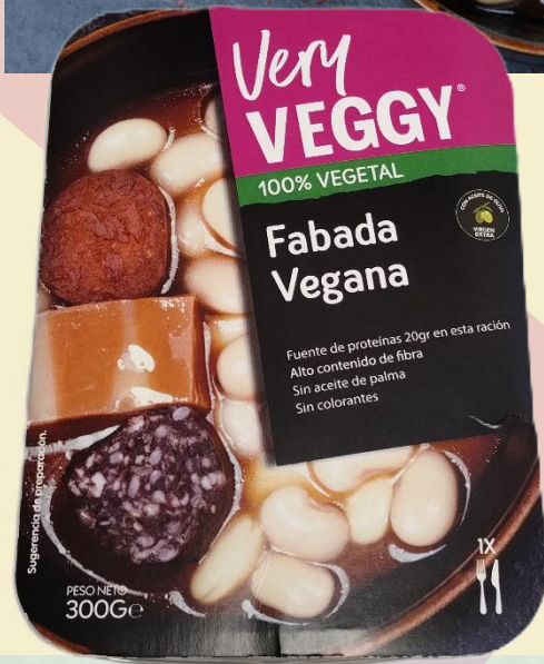
Fabada Vegana 300g