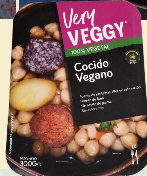
Cocido Vegano 300g