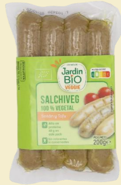
Seitán y Tofu 4*50g