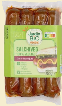
Estilo Frankfurt 4*50g

Podemos decir orgullosos que las salchichas es nuestro producto Estrella ya que somos el fabricante número 1 de salchichas 100% vegetales en España, gracias a su cuidada elaboración, versatilidad y variedad de sabores.